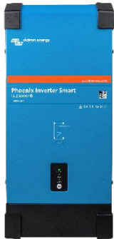
Convertisseur Phoenix Smart 12/2000